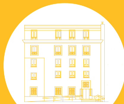
Casa del Cura