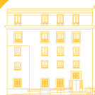
Casa del Cura

Observaciones y análisis dinámico actualizado del Distrito Centro.